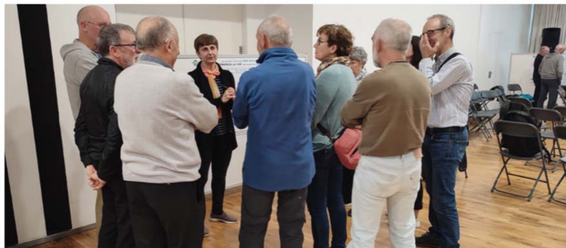
Foto: Tercer taller participativo. Debate en uno de los grupos de trabajo.