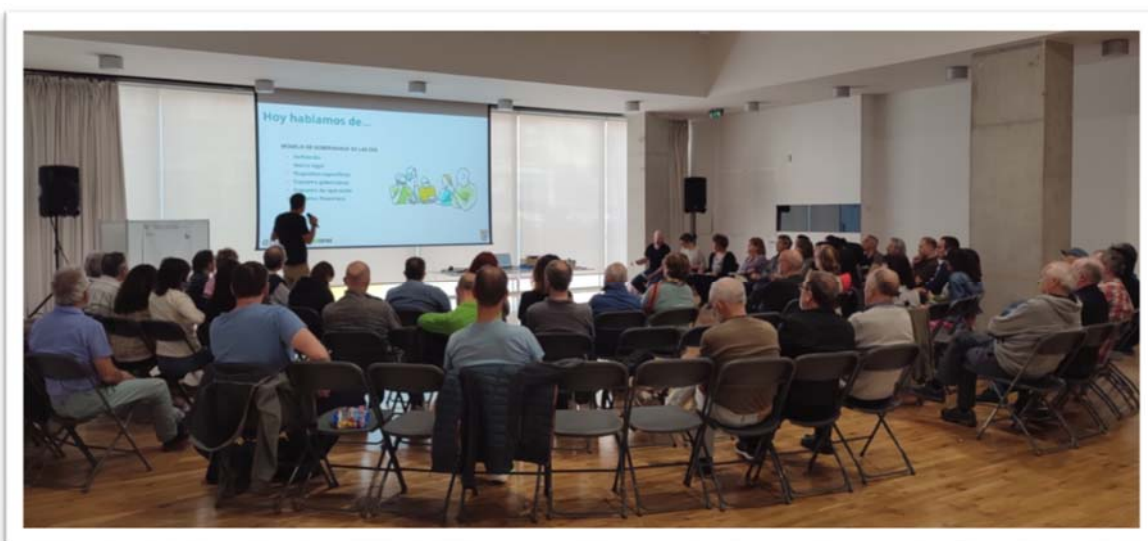
Foto: Tercer taller participativo. Presentación de los modelos de participación y gobernanza en una CER.