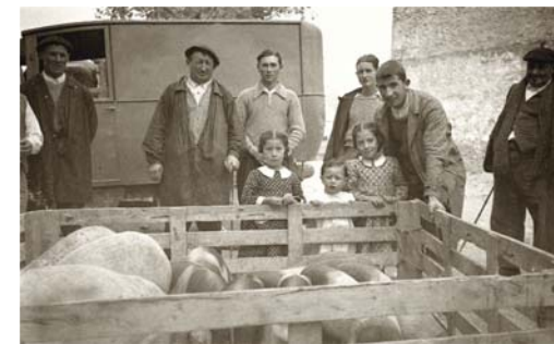
Años 30. Cambretas, vallado con cerdos. Colección Butini