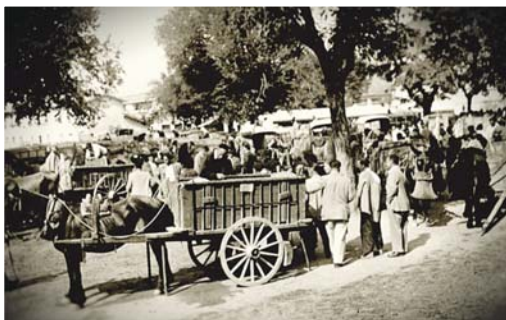
Años 50. Mercado con carro y patente.

hacer frente a las escasas arcas domésticas.