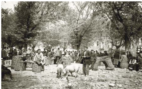
Años 20. Se aprecian anganetas y esportizos.

A principios del siglo XX en Huarte los días 8, 18 y 28 de cada mes se celebraba una feria de ganado principalmente porcino y en su mayor parte gorrines. Los orígenes se remontan a la feria de ganado que con motivo de las Fiestas de la Hermandad se celebraba desde hace centenares de años. Esas fechas habían variado a lo largo de los años pero hasta poco antes de su supresión eran aquéllas. Especial relevancia tenían las Ferias de las Fiestas de la Hermandad en las que se celebraba mercado dos días: lunes y martes. Eran muy concurridas. En estas ferias sí que se solía vender ganado lanar.