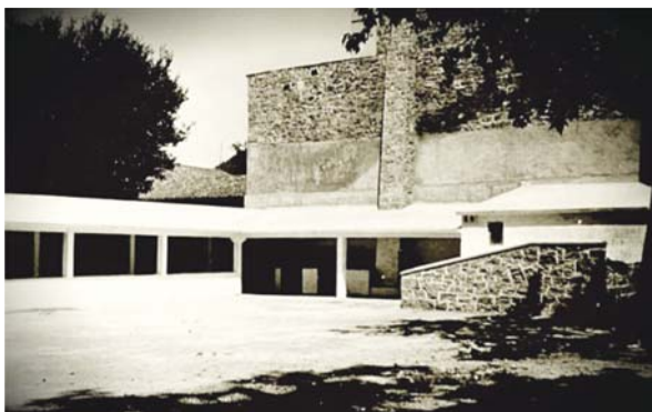
Años 50. Coquiqueras, peso y descargadero.

Tristes eran los casos que se daban de no vender, por causas muy diversas... y tener que volver a los pueblos respectivos, a horas de camino por delante, con los gorrines. Esto suponía gran desazón para la mujer e hijos, en algunos casos necesitados de esos duros para