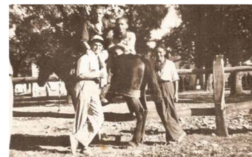
Años 40. Mozos en Fiestas donde las estacas.